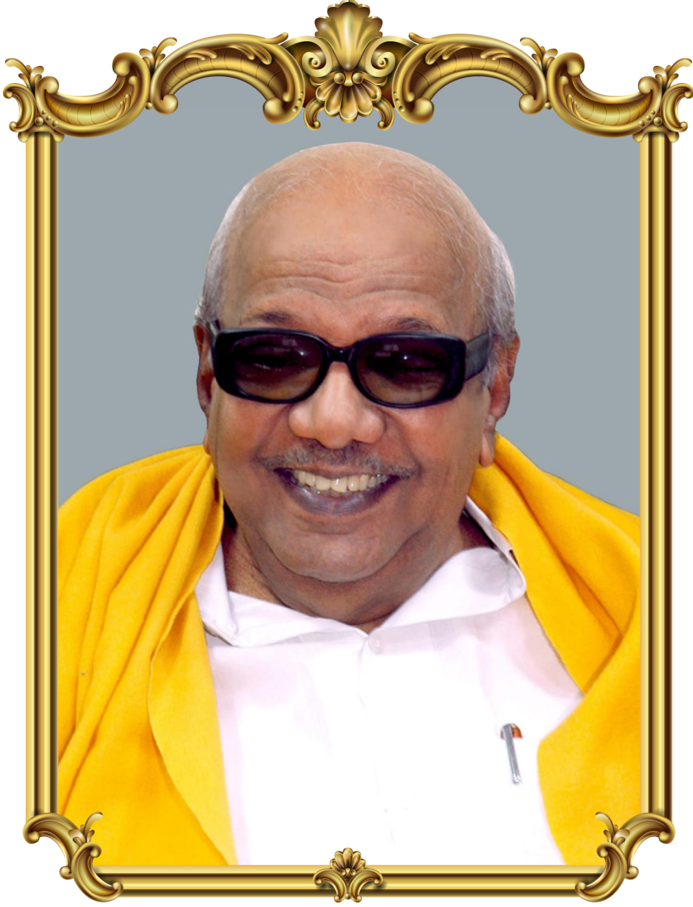
முத்தமிழ் அறிஞர் டாக்டர். மு. கருணாநிதி அவர்கள்