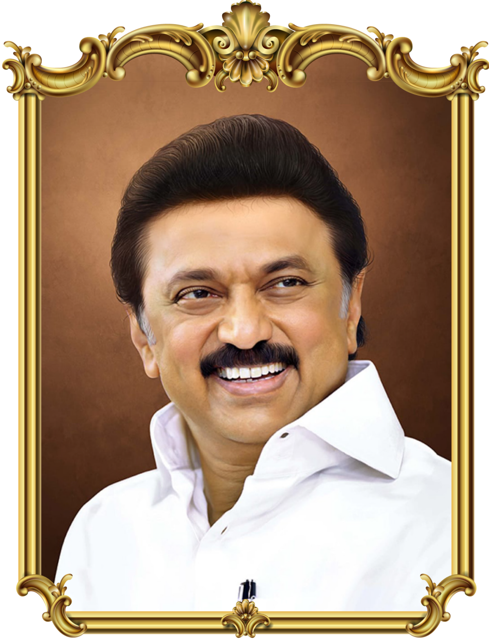
மாண்புமிகு தமிழ்நாடு முதலமைச்சர் திரு. மு.க. ஸ்டாலின் அவர்கள்